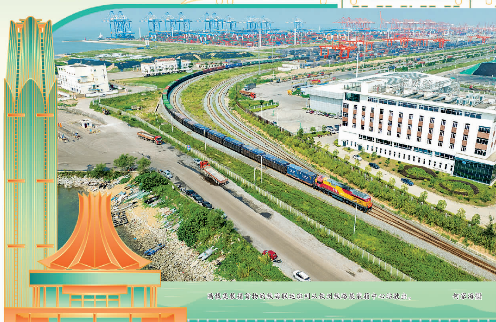
满载集装箱货物的铁海联运班列从钦州铁路集装箱中心站驶出。

策合力支持下，全程铁海联运‘一口价’降幅约30%。西安至北部湾港线路还可享受陆路启运港退税试点政策，大幅压缩企业资金占用成本和周转时间。” 广西还建立西部陆海新通道集装箱下浮品名“负面清单”，班列覆盖品名达1.1万个，基本涵盖内外贸适箱货源，实际运输货物品名从最初的50多种增至目前的1100余种，有效降低通道综合物流成本。 通道的数字化建设也在助力效率提升。9月20日，中越边境智慧口岸中方项目顺利开启智慧无人车通关流程、作业流程。该口岸建成后，货物可实现24小时不间断、无人化、智能化通关。 加快信息化、智慧化提升改造，使口岸通关能力和效率显著提升。“2023年，广西口岸进口整体通关时间比2017年减少41个小时，出口整体通关时间减少13个小时，位居全国前列。”广西壮族自治区发展和改革委员会二级巡视员陆赞说。 一系列“组合拳”吸引货源滚滚而来，使北部湾港铁海联运班列、中越跨境班列、航空货运等多种物流组织模式迅速发展。5年来，北部湾港铁海联运班列服务范围由最初的7省16市30站拓展至18省73市156站，实现西部12个省份全覆盖并延伸至中部地区。北部湾港集装箱吞吐量从2019年的382万标箱增长至2023年的802万标箱，年均增长20.4%。 10月23日，西部陆海新通道铁海联运班列年内累计发运货物突破70万标箱。今年截至9月25日，广西始发中越班列发运货物突破1万标箱，同比增长1431%，创历史新高。今年1月至9月，北部湾港集装箱吞吐量完成656.9万标箱，增长14.3%；货物吞吐量完成3.3亿吨，增长3.2%。