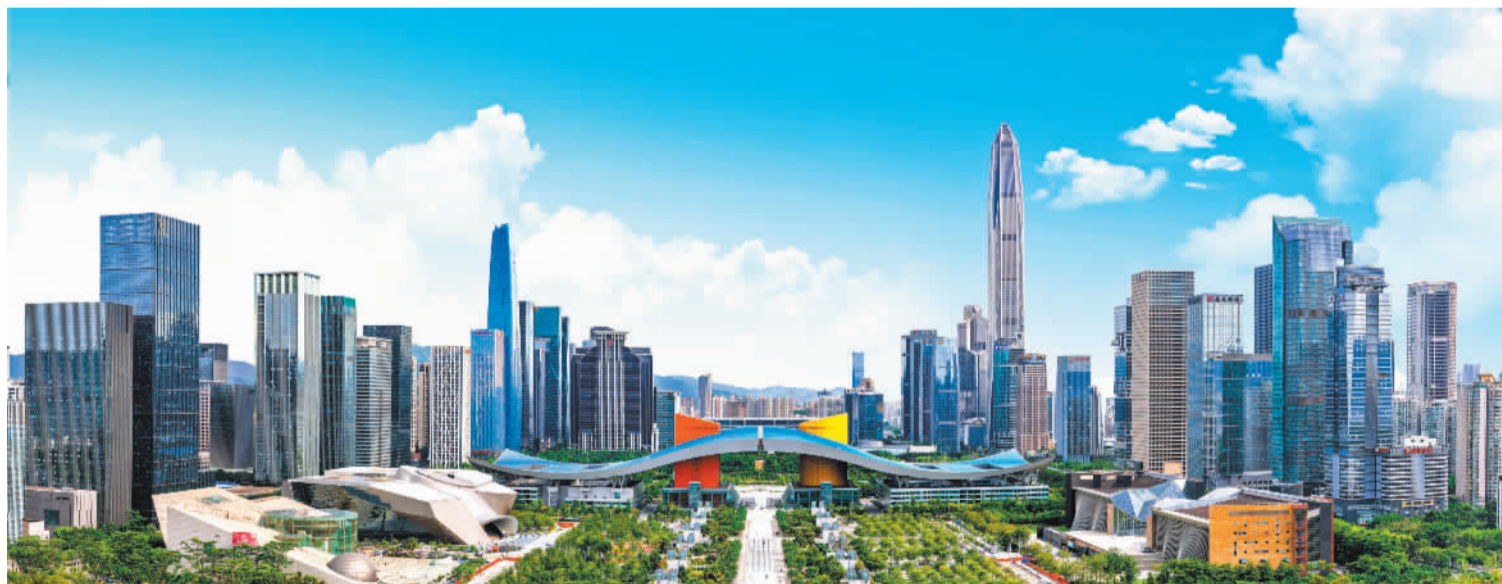
深圳市中心城区福田区正积极打造“全域超级孵化器”

基于量子物理、人工智能、云计算及大规模实验机器人集群等前沿技术与能力，为生物医药、化工、新能源、新材料等产业提供创新技术、服务及产品的晶泰科技公司展出以AI和机器人驱动的创新研发平台“智能