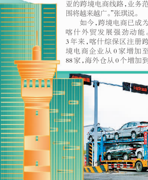
霍尔果斯海关关员在查验出口商品车车辆信息。

要进一步聚焦人才队伍建设。自贸试验区高质量发展离不开高技术人才队伍支撑。各片区应积极与高校、科研机构深度合作，为人才提供更多了解和参与自贸试验区建设的平台。同时，加大引才力度，搭建创新创业平台，制定科学合理的人才薪酬和科研成果奖励机制，激发人才创新活力；加大人才自主培养力度，探索适应当地发展的人才培养方式，将自贸试验区打造成人才集聚高地。