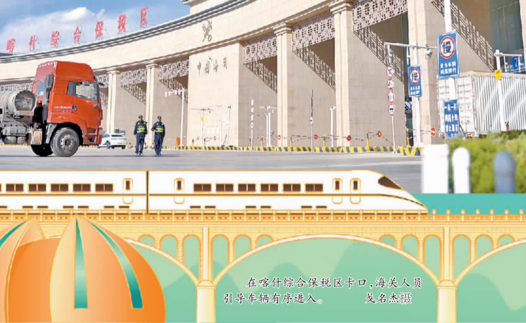
在喀什综合保税区卡口，海关人员引导车辆有序进入。

高功能区企业投放贷款52笔，金额4.4亿元。外贸订单结汇提速，是新疆自贸试验区成立后新疆外贸快速发展的缩影。数据显示，今年前三季度，乌鲁木齐市高新技术产业开发区外贸进出口总额同比增长79.14%。