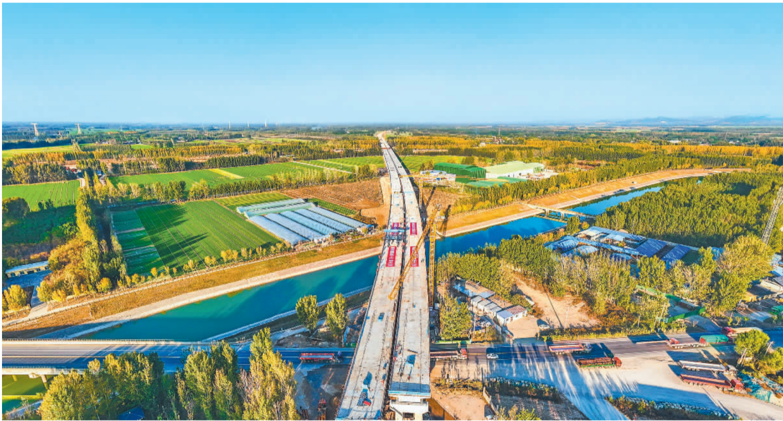
近日,位于山东省聊城市的山东东阿高速公路控制性工程——跨南水北调输水渠特大桥全线合龙。该工程由铁建投资牵头投资建设、中铁二十二局承建,其建成后将为山东东阿高速公路2025年底如期通车,加快形成高速区域网奠定坚实基础。

旧换新政府补贴政策,家电品类销售增长较为明显。近期,各地方政府促消费政策不断加码,消费券品类也不断拓展,线上线下融合的消费场景搭建成为政策支持的重点方向,将持续驱动相关领域消费的快速增长。此外,国潮在今年“双11”中表现依然突出。国潮品牌通过电商平台实现更广泛传播和销售,展现出文化自信与商业价值的双重提升,体现了新经济下的消费新趋势。朱克力说,国潮兴起既是基于消费者对本土文化的认同加深,更是随着国潮品牌在设计、品质、创新上的不断提升,愈发满足消费者对个性化、高品质商品的需求。