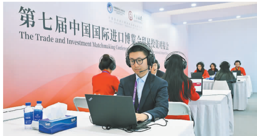
第七届中国国际进口博览会贸易投资对接会视频对接区

开放是进博会的核心理念。每一年进博会现场,中国银行都会举办或者支持多场主题论坛活动,为强化金融创新、推动高水平对外开放、加速构建“双循环”新发展格局贡献“中行智慧”、提供“中行方案”。