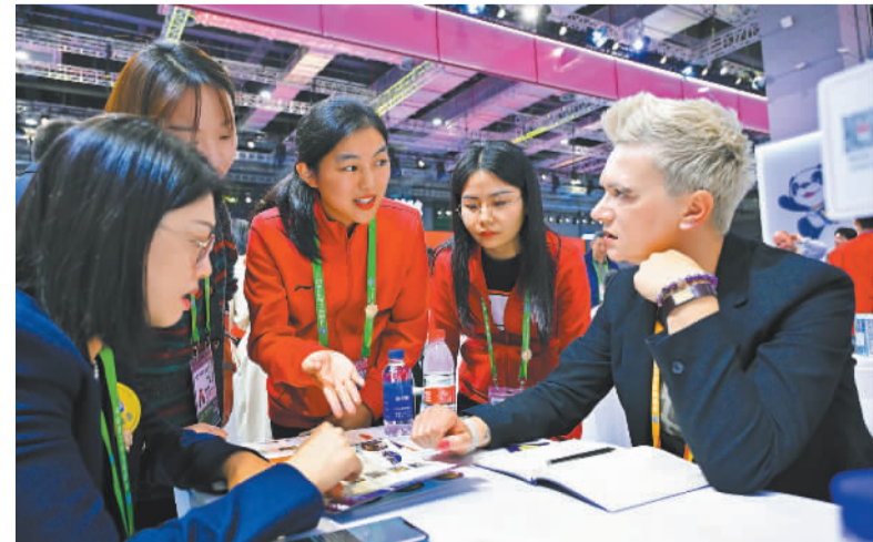
中国银行为中国国际进口博览会参展商、采购商、投资商等提供集贸易洽谈、投资交流、金融对接为一体的综合服务