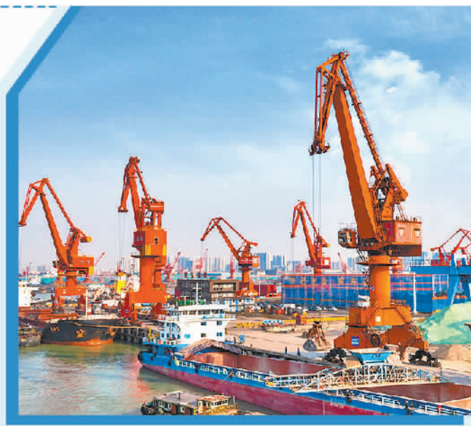
浙商中拓打造的位于江苏无锡的物流码头。(资料图片)

不久前,位于泰国南部的一家乳胶工厂开工。该工厂有效整合了当地橡胶种植和加工产业链,仅用3个月时间,项目新签实物量达到近2000吨,可用于生产140万只乳胶枕头,不仅为当地创造了很多就业机会,还为橡胶供应链强链补链提供了有效支撑。