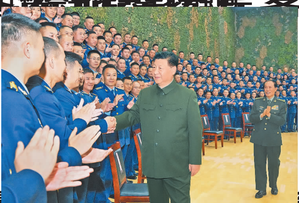
11月4日，中共中央总书记、国家主席、中央军委主席习近平到空降兵军史馆视察。这是习近平亲切接见空降兵军官代表。