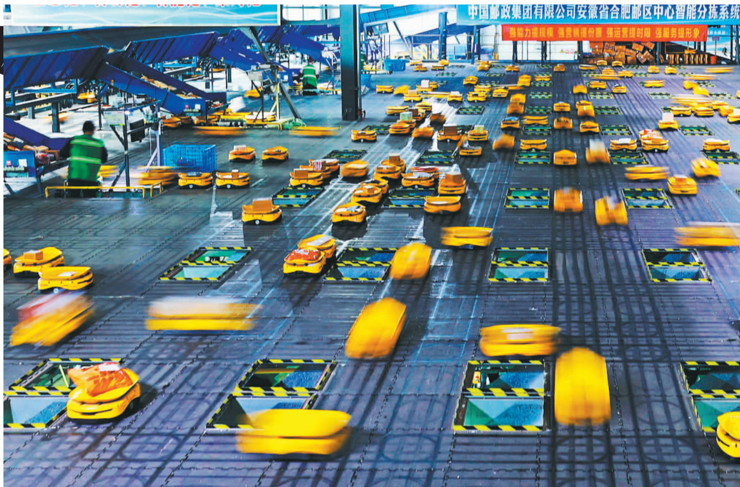
▲11月1日,安徽合肥邮区中心皇藏峪路场地,智能分拣机器人在作业平台分拣快递包裹。机器人分拣效率可提升2倍至3倍。