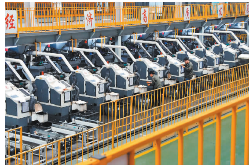
▲10月30日,位于河北邯郸永年工业园的河北喜力德五金制造有限公司,工人在数字化智能生产车间加工钻尾丝。