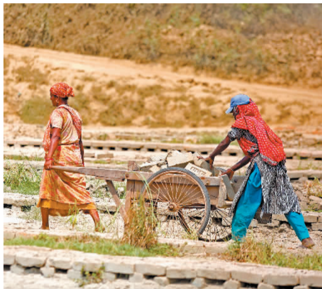
图为在孟加拉国首都达卡，工人们在烈日下工作。

加强国际合作至关重要。气候变化是全人类面临的共同威胁，报告强调了国际合作在应对气候变化中的重要性，并就实现可持续发展和公平过渡的目标提出了建议。报告呼吁，建立平台，促进各国之间的技术合作和知识共享，特别是向发展中国家分享绿色技术；建立全球气候资金，为发展中国家提供资金和技术支持，帮助其增强气候行动能力；加强能力建设，提供培训、技术援助和咨询服务，帮助发展中国家提高气候行动能力。