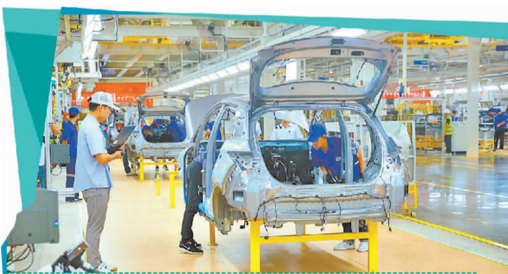
工人在位于泰国罗勇府的比亚迪泰国工厂工作。

政府的一系列举措使得越来越多的泰国民众开始将电动汽车作为重要选择。2023年，泰国电动汽车的销量占国内汽车总销量的9%，预计到2024年底，这一数字将翻倍。今年前5个月，泰国全国电动汽车的新注册量比去年同期增长了31.64%，已成为泰国汽车业疲软背景下反向增长的亮点。在曼谷工作的年轻人艾拉弗称，他正在考虑将现有的燃油车更换为新能源汽车，以减少每月高达4000泰铢至5000泰铢的油耗。多家在泰中国车企表示，泰国消费者在