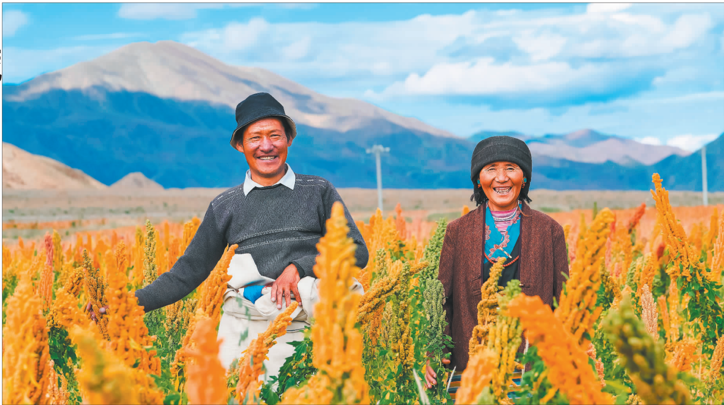
▲9月15日,拍摄于西藏日喀则市萨迦县扯休乡的藜麦种植基地。该基地由上海市第十批援藏萨迦小组对接推动,试点撂荒地上种植藜麦,2023年带动农民增收约210万元。