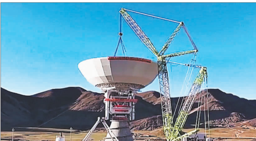
▲10月7日,日喀则40米射电望远镜顺利完成天线系统主反射体吊装。该项目是中国科学院与西藏自治区合作的科技项目,将承担探月四期和深空探测VLBI测定轨任务。