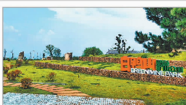
湖北麻城市白鹤山矿山公园。

去年，该市178家规模以上石材企业完成工业产值210亿元。麻城市委书记汪国兵说，麻城将持续开展市场开拓、产业升级、生态治理、技改提能、数智赋能、人才培养、安全生产等行动，推动石材产业向“需”发力、向“绿”而行、向“高”攀升、向“新”奋进，不断提升石材产业发展规模和能级。