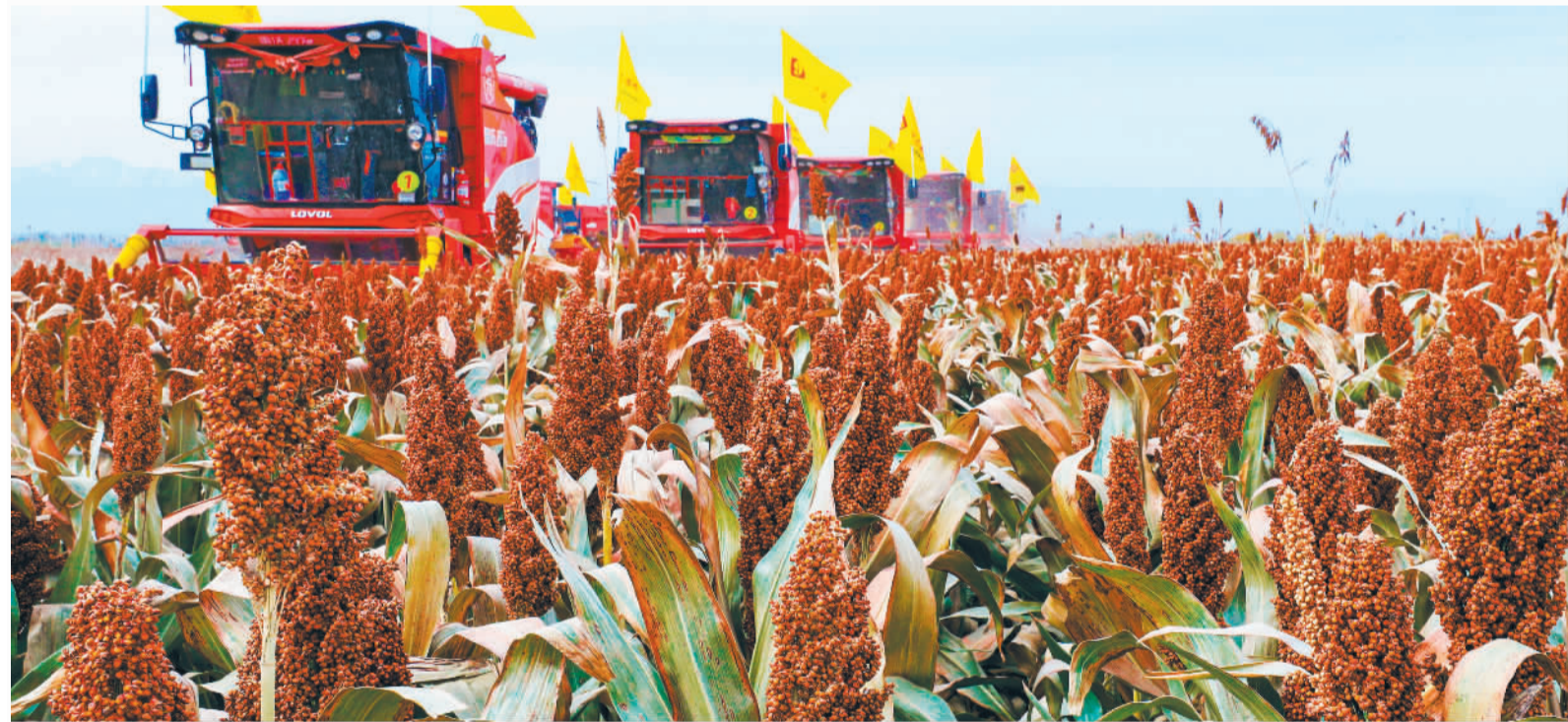
▲10月16日,甘肃省张掖市民乐县有机红高粱种植基地,大型收割机在收割高粱。