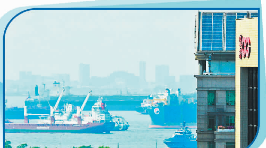
5月23日，船舶航行在新加坡海峡。

数字身份和信任体系的不完善也是阻碍因素。缺乏统一的数字身份认证系统和信任机制，使得跨境电子商务面临安全和信任问题，特别是在金融和技术服务行业。这限制了全球电子商务的发展，需