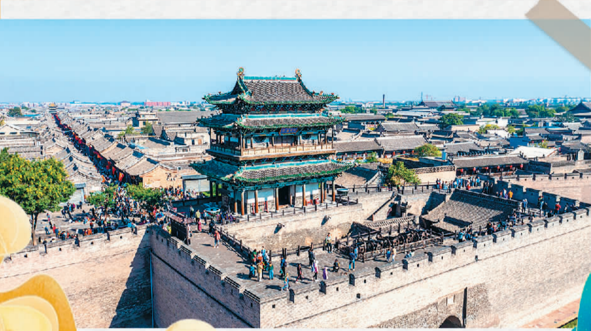
10月3日，游客在山西省晋中市平遥古城游览。

“山西流量接稳啦”“在山西万物皆可醋”“网友护短山西”“山西大同降大雪，老天爷照顾游客还原游戏场景”“山西高铁乘客集体午睡”……这个国庆假期，关于山西的话题着实不少。山西确实火了，国庆假日期间，山西66个重点监测景区(65个开放，蟒河景区因前往景区道路施工闭园)累计接待游客784.46万人次，较上年同期增长46.9%；累计门票收入25466.31万元，较上年同期增长17.13%。