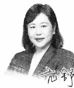
□ 本报记者 吉亚娇 李景

从长远看,我国城镇化进程持续推进,房地产发展新模式加快构建,房地产市场仍然具有较大潜力和空间。各地有必要继续坚持因城施策,加快各项政策落实,促进房地产市场逐步实现平稳健康发展。