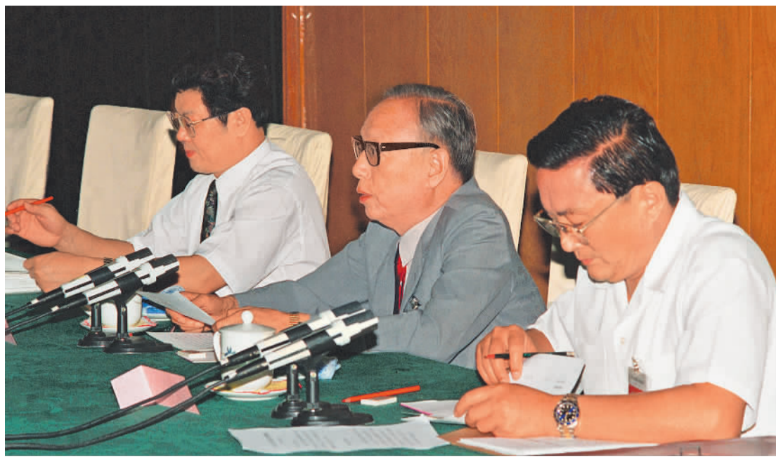
1994年7月21日,任建新同志(中)在北京出席第三次西藏工作座谈会时就《中共中央、国务院关于加快西藏发展、维护社会稳定的意见》作说明。