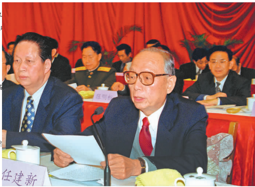
1999年12月17日,任建新同志(右)在北京出席庆祝最高人民法院成立50周年暨全国法院英模表彰大会并讲话。