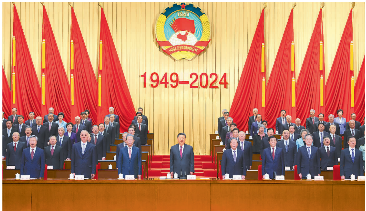
9月20日上午，中共中央、全国政协在全国政协礼堂隆重举行庆祝中国人民政治协商会议成立75周年大会。习近平、李强、赵乐际、王沪宁、蔡奇、丁薛祥、李希、韩正等出席大会。