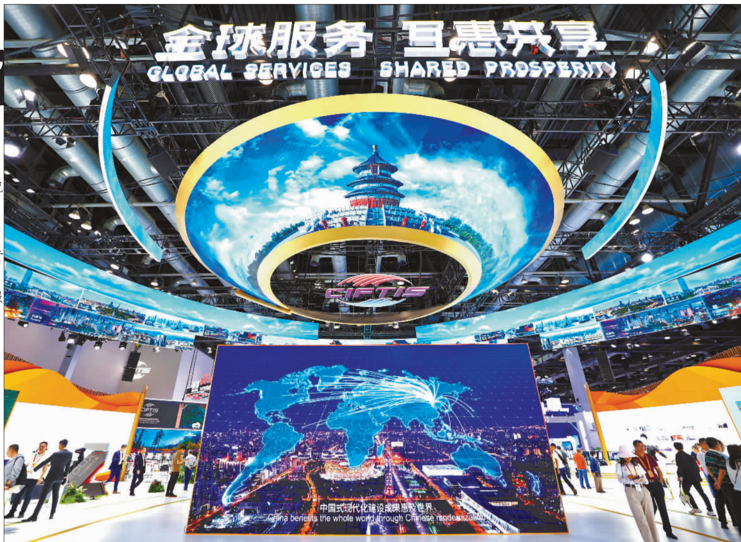
▼9月14日,2024年中国国际服务贸易交易会国家会议中心展区,观众络绎不绝。本届服贸会以“全球服务,互惠共享”为主题,聚焦“新而专”的展览展示,打造国际交流、交易平台。