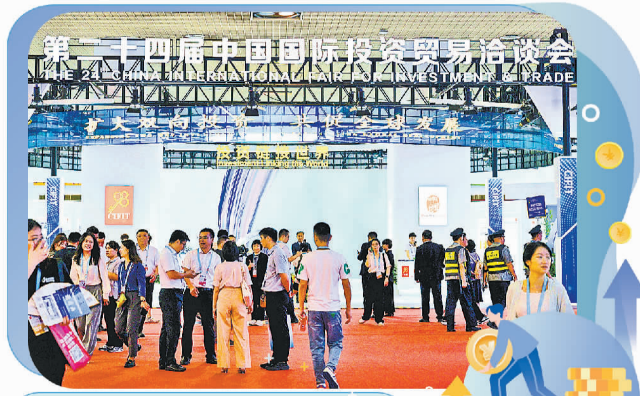
图为第二十四届中国国际投资贸易洽谈会中心展馆。