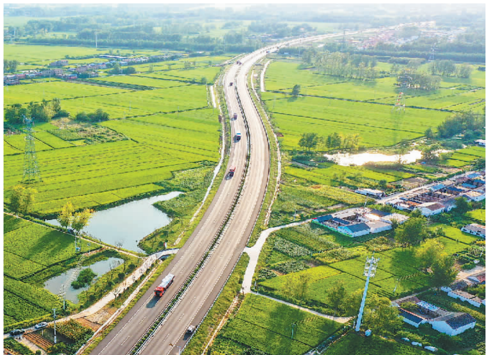
近日，在江苏省宿迁市泗阳县来安街道，纵横交错的交通网与田野、民居等构成一幅欣欣向荣的乡村画卷。近年来，泗阳县大力推进交通路网建设，有效带动乡村旅游发展和特色农产品流通，助力乡村振兴。