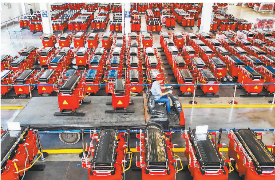
8月23日，位于江苏省海安市高新区的江苏瑞恩电气有限公司车间内，工人正在巡查智能干式电力变压器系列产品。近年来，海安市积极推动电气产业快速向智能化、高端化、集群化、国际化方向转型。

滕州市不断强化企业创新主体地位，以创新驱动产业迈向中高端，推进“创新型中小企业—专精特新—制造业单项冠军—专精特新”小巨人”和“国家制造业单项冠军”梯队培育体系建设，今年已成功申报专精特新中小企业79家，同比增长97.5%，全市现有单项冠军、专精特新等高成长型企业218家。1月至6月，全市规模以上工业增加值同比增长8.9%，工业生产呈现稳定增长趋势。 今年以来，滕州市把专精特新企业培育作为推动高质量发展的重要抓手，筛选11个原创性创新项目和102个技改项目进行重点支持。“通过‘一企一策’培育帮促，加快创新链、产业链、资金链、人才链深度融合，切实以新质生产力激活工业经济新动能、塑造发展新优势。”滕州市委副书记、市长周刚说。