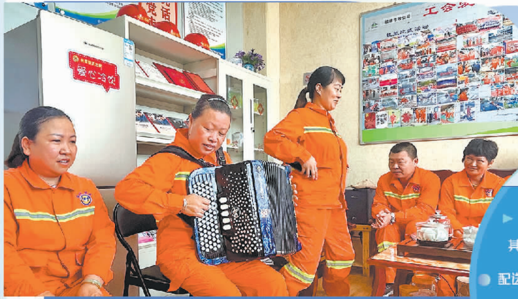
福建省厦门市海沧区坪里工会爱心驿站对新就业形态劳动者开放。

快递员、外卖骑手、网约车司机……随着移动互联网新业态的普及，全国各地随处可见那些“奔跑”在大街上的新就业形态劳动者。福建省厦门市高度重视新就业形态劳动者权益保障工作，通过畅通维权渠道、加大职业伤害保障、加强便利场所建设、引入应急救援培训、探索“零工市场”就业服务等方式，持续完善制度机制、创新工作方式，强化服务保障，支持和规范发展新就业形态，为劳动者创造更好的发展环境、职业环境。