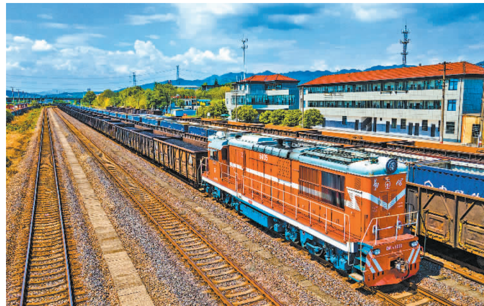
8月20日，浙江省金华市铁路塘坊货场内，满载煤炭等重点物资的列车在轨道上有序运行。进入8月以来，浙江省大范围持续高温，企业和居民用电需求不断攀升，区域内电厂发电量创历史同期新高。为此，铁路金华车务段全力加强电煤重点物资运输，保障管辖区内供电企业用煤需求。

“您的诉求是什么？工资发放情况有记录吗？”在厦门市新就业形态劳动者权益保障服务中心会议室里，工作人员通过视频会议的方式就新就业形态劳动者工资发放所产生的争议与当事双方进行沟通。