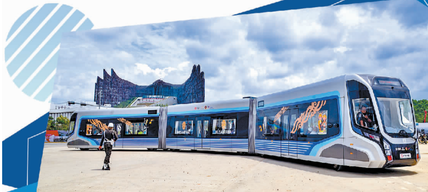
这是8月12日在印度尼西亚新首都努山塔拉拍摄的智轨系统。