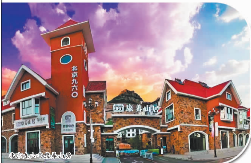
北京九六〇康养山居