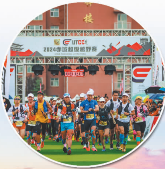
2024赤城超级越野赛开跑