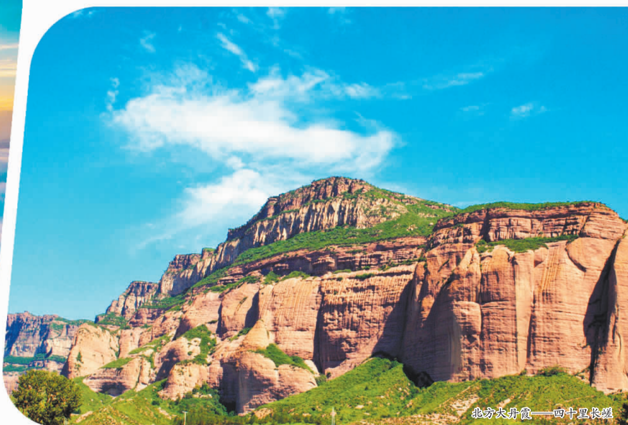
北方大丹霞——四十里长崖