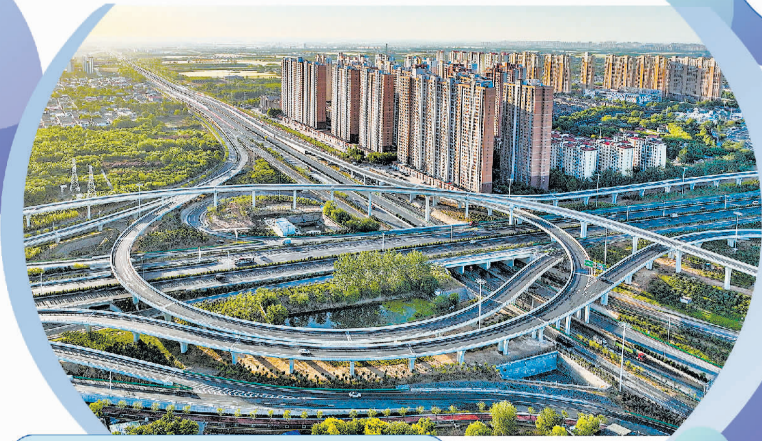
石家庄市复兴大街与南三环互通立交桥。