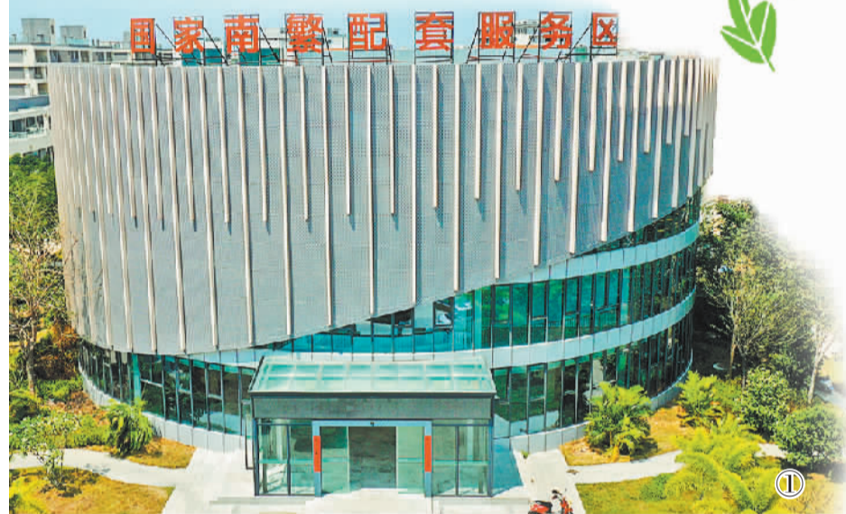
国家南繁配套服务区

①7月8日，位于乐东县黄流镇的国家南繁科研育种基地配套服务区，将打造成为集种业科技创新、农业生产、农耕体验、科普展示、文化会展于一体多元化文旅融合基地。