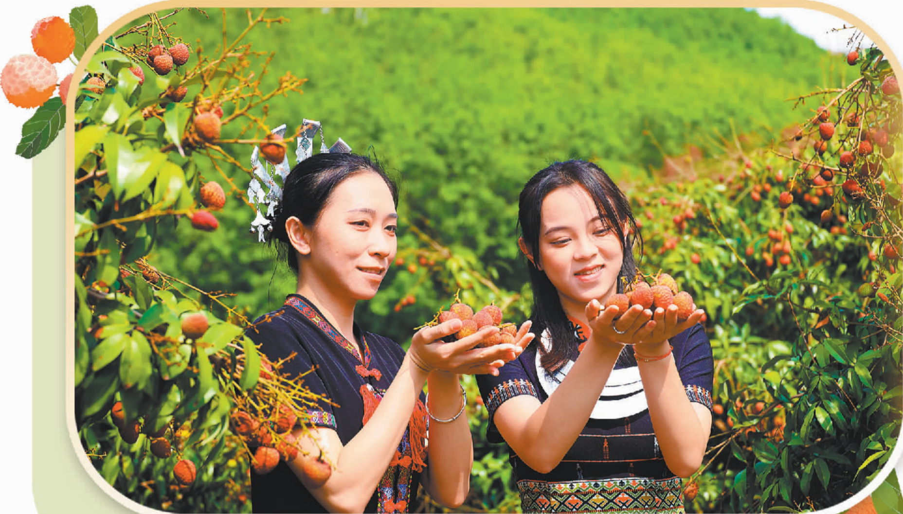
▲3月26日，黎族姑娘采摘“桂花香”荔枝。乐东“桂花香”荔枝是全国最早上市的荔枝，每年3月份就可以采摘上市销售。