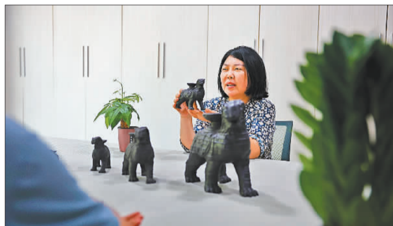
▶7月18日，一家文创设计机构展示铁狮文创产品。沧州铁狮子是全国重点文物，也是沧州人的精神图腾。