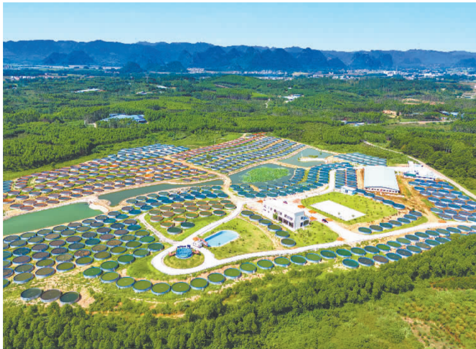
7月25日,广西贺州市平桂区鱼跃天下陆基渔业生态养殖产业示范区,一个个陆基圆池整齐排列。近年来,该示范区采用“公司+基地+农户”的发展模式,引导农户发展生态渔业养殖,助力乡村产业振兴。

对于这股火热出圈的青年午校风,浙大宁波理工学院教授、传媒与法学院学术委员会主任何镇魁表示,身处新时代,年轻人需要广泛、易得、多样化的学习资源与学习机会。午校作为夜校的补充,为青年群体提供了更加多样化的学习时段选择,同时还能在资源、信息甚至就业路径上为其提供帮助,值得点赞。