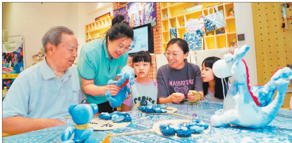
▼7月13日，居民在方庄芳华里康养社区参与手工制作活动。丰台区推动城市更新与养老服务有机结合，将养老服务延伸到社区和家庭，让老年人住得顺心、放心。