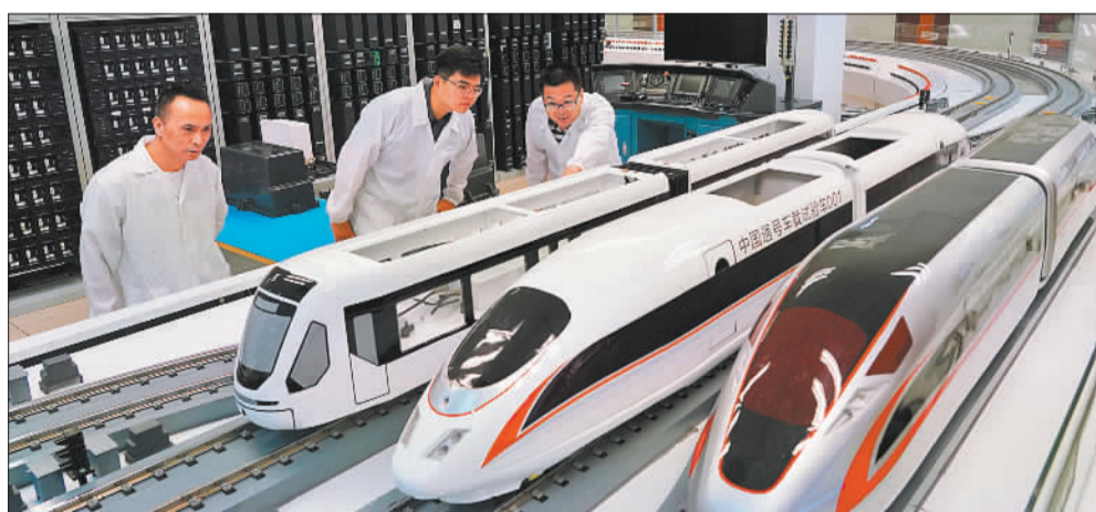
▲7月11日，位于中关村丰台园的中国通号研究设计院集团工作人员在进行模拟测试。中关村丰台园聚集轨道交通企业超170家，是轨道交通装备领域“国家新型工业化产业示范基地”。