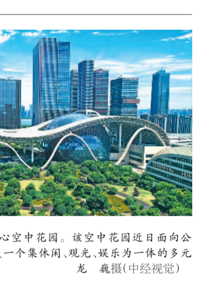
7月18日拍摄的杭州国际博览中心空中花园。该空中花园近日面向公众免费开放,总面积约6.5万平方米,是一个集休闲、观光、娱乐为一体的多元化公共空间。

高温防护等职业健康知... 督促用人单位按... 时合规范发放高温津... 各地人社部门应... 加强与卫健、应急、工... 会等部门的信息共享... 高温重点时段联合... 开展监督检查专项行... 动。督促企业严格落... 实高温津贴制度,向符... 合规定劳动者按时... 足额发放高温津贴... 对未按有关规定标... 准发放高温津贴的行... 为一经发现坚决予以... 查处。