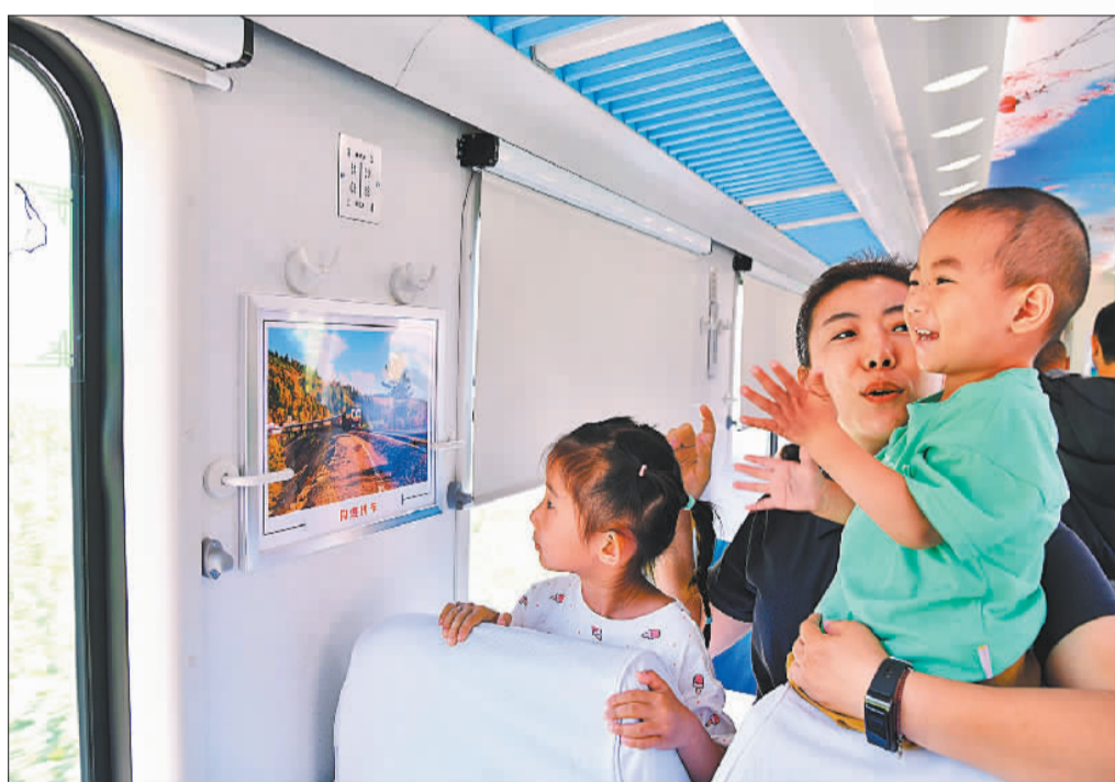
◀7月10日,游客在通化至集安4347次列车上体验“火车大集”乐趣。近年来,铁路部门与当地文旅等部门合作打造慢火车“乡村旅游线”,为沿线居民提供了便捷的出行方式。