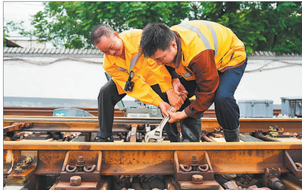
▶7月8日,中国铁路郑州局集团有限公司洛阳电务段洛阳东车间职工在洛阳东场进行安全检修。在防洪防汛关键阶段,铁路部门严格落实“超前防、主动避、有效抢”工作要求,确保暑运安全有序。