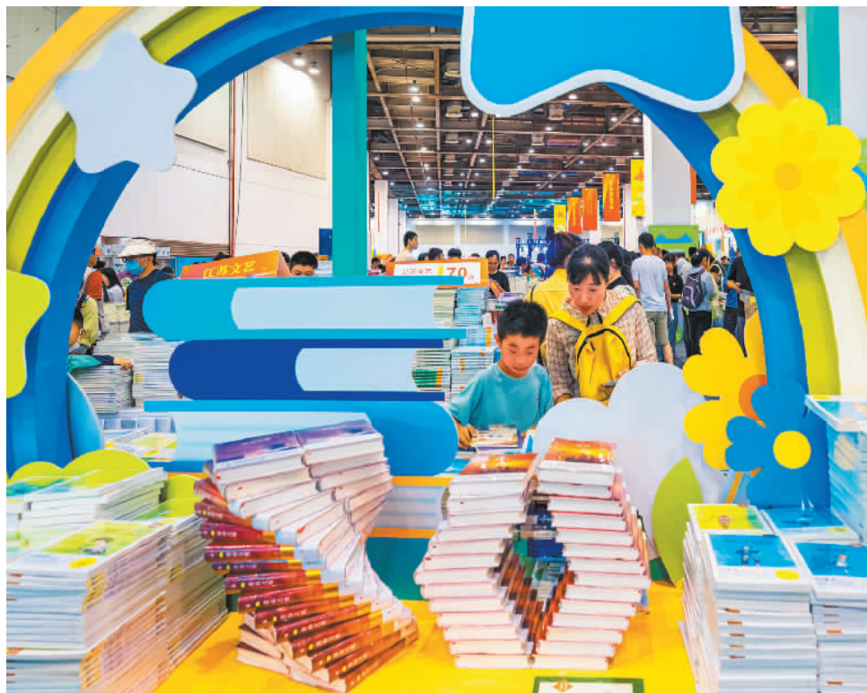
7月7日，苏州国际博览中心，读者在第十四届江苏书展上选购图书。本届书展汇聚了全国400多家出版发行单位，超8万种出版物参展，为广大读者带来一场书香四溢的文化盛宴。

董希淼认为，银行应以客户为中心，以安全为底线，以便利为目标，通过不断提高安全性和优化客户体验，建立起更加稳固的客户关系，进而提升自身在市场上的竞争力。