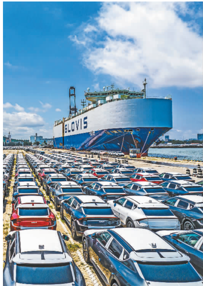
7月6日,在山东港口烟台港码头,商品车等待装船“出海”。近年来,烟台港积极打造商品车物流枢纽港,今年上半年完成商品车全模式运量36.7万辆,同比增长40.5%。