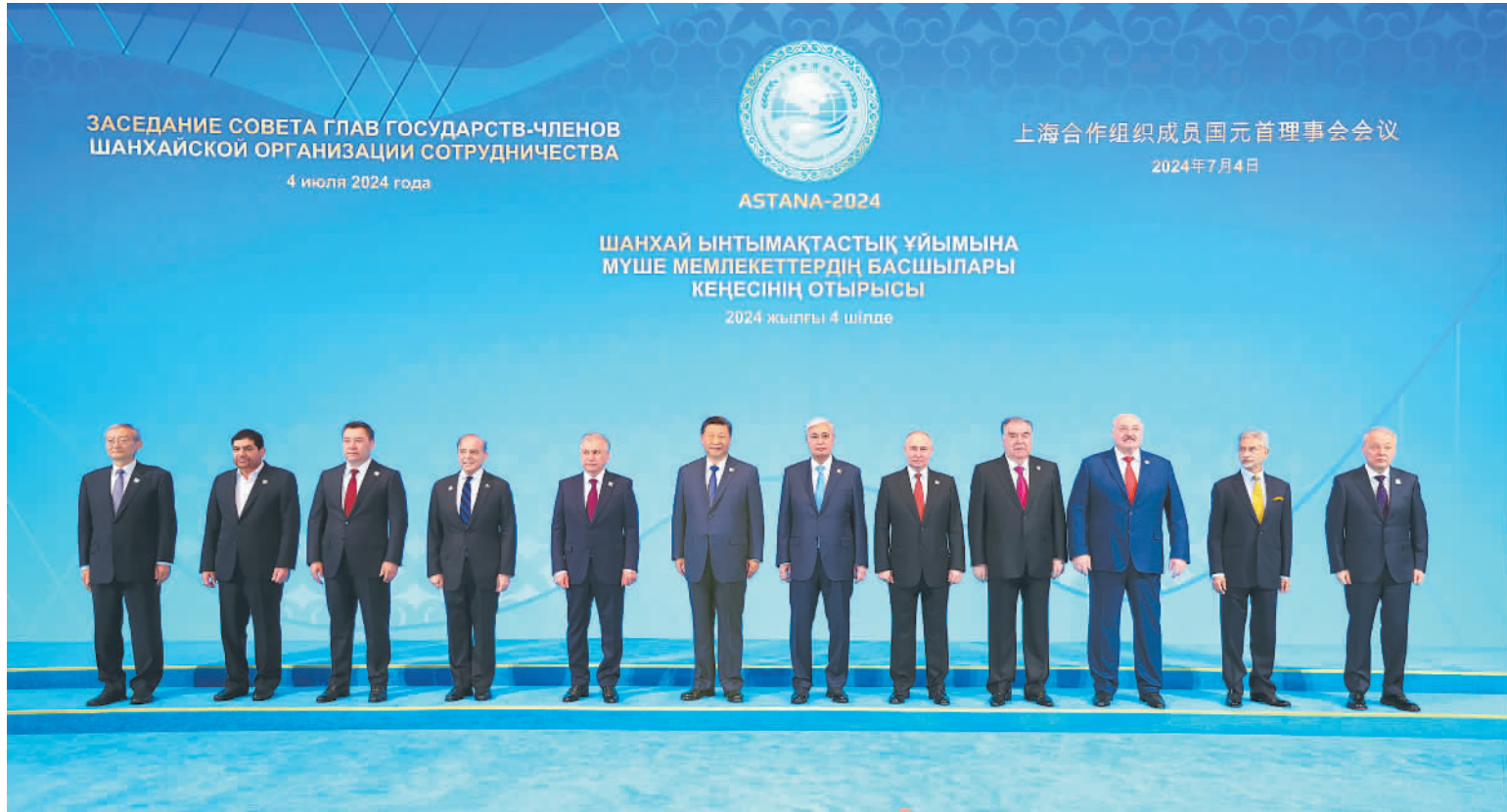
当地时间7月4日上午，国家主席习近平在阿斯塔纳独立宫出席上海合作组织成员国元首理事会第二十四次会议。