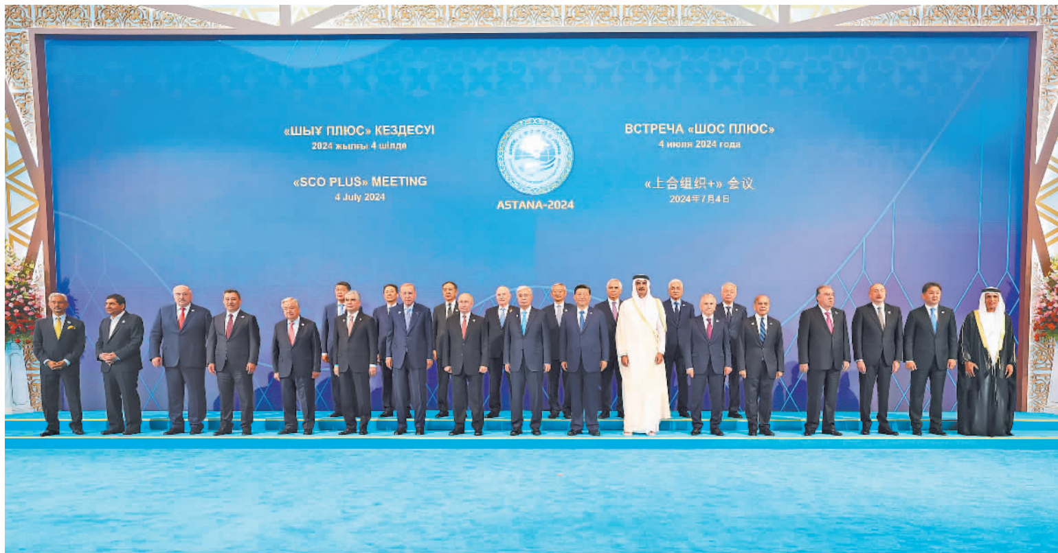
当地时间7月4日下午，国家主席习近平在阿斯塔纳出席“上海合作组织+”阿斯塔纳峰会并发表题为《携手构建更加美好的上海合作组织家园》的重要讲话。