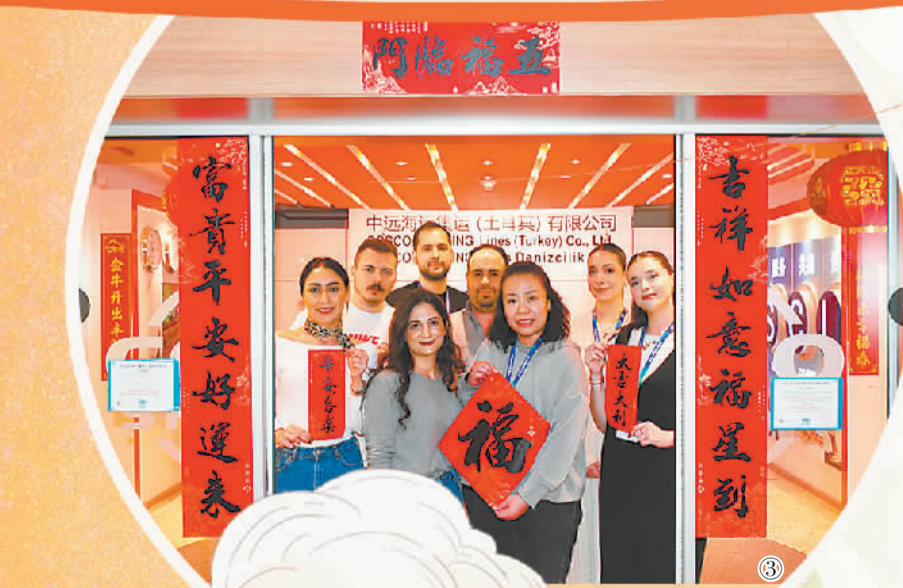
图③ 土耳其伊斯坦布尔，“一带一路”合作项目上的中外员工一起庆祝中国龙年春节的到来。

构建新发展格局是发展问题，但本质上是改革问题。着力打通经济循环卡点堵点，加快建设全国统一大市场，促进生产、分配、流通、消费各环节有机衔接，推动供需良性互动……顺势而为、精准施策，我们完全有条件构建新发展格局、重塑新竞争优势，为中国经济行稳致远注入更持久更稳定的动力。