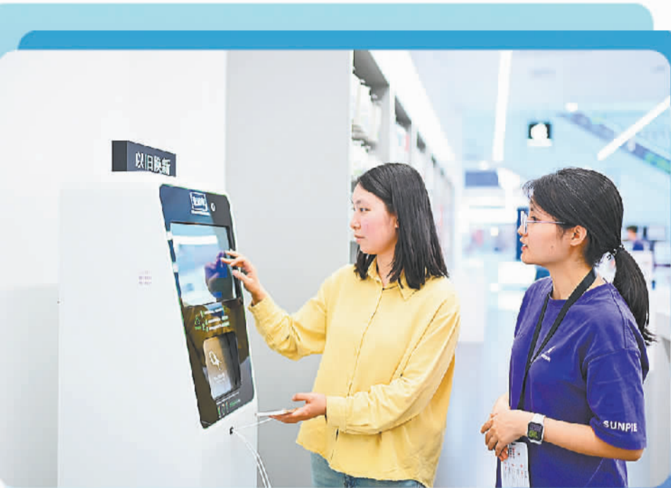
在重庆市沙坪坝区融创茂商场,工作人员向市民介绍手机回收机器人的使用方法。

有数据显示,2023年我国二手手机回收约2.8亿部,其中2.5亿部以上用于直接销售或翻新销售。预计“十四五”期间,手机闲置总量累计将达到60亿部,二手手机潜在价值