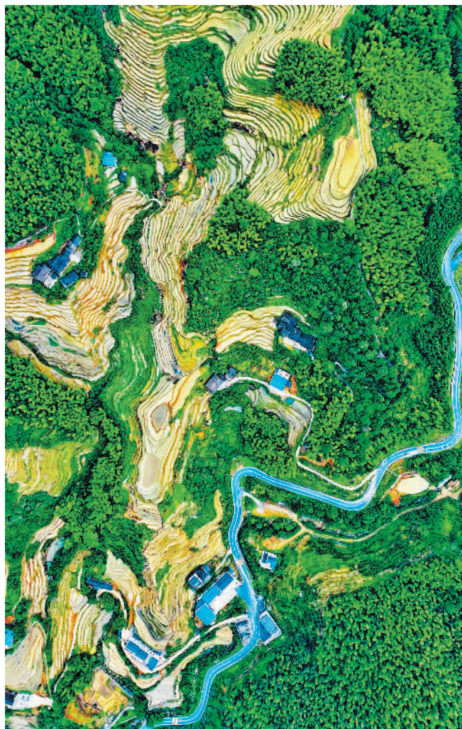
5月30日,江西省赣州市崇义县上堡乡,梯田与民宿、公路共同构成怡人美景。近年来,当地通过“四好农村路”建设和农村人居环境优化,带动村民发展乡村旅游增收,村庄面貌焕然一新。

湾区“大号地铁”也串联起了沿线产业发展链条。如肇庆市近年来积极承接广州、佛山制造业供应链转移,加快建设粤港澳大湾区西部制造新城。暨南大学教授胡刚表示,城际轨道是大湾区的骨干交通,湾区“大号地铁”开通将更方便人员流动,沿线产业协作将更加紧密,肇庆、惠州等城市将加快融入广深等大湾区核心引擎城市发展当中。