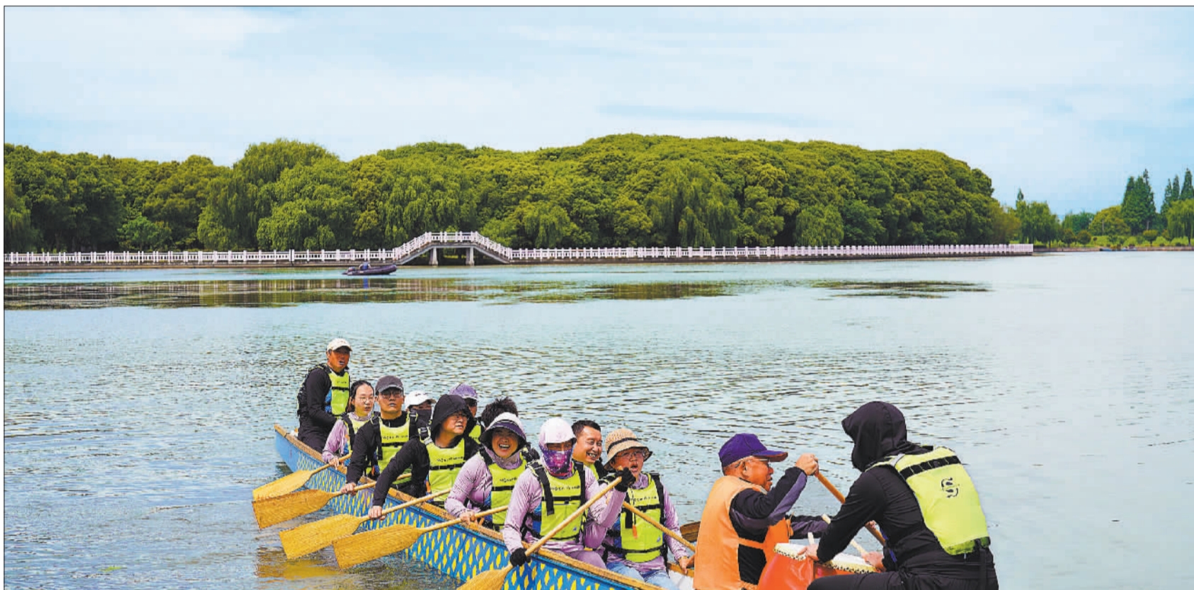
▲4月20日，上海市青浦区西部的青西郊野公园，绿意盎然。该公园位于青浦区大淀湖畔，是上海市唯一一个以湿地为特色的郊野公园。