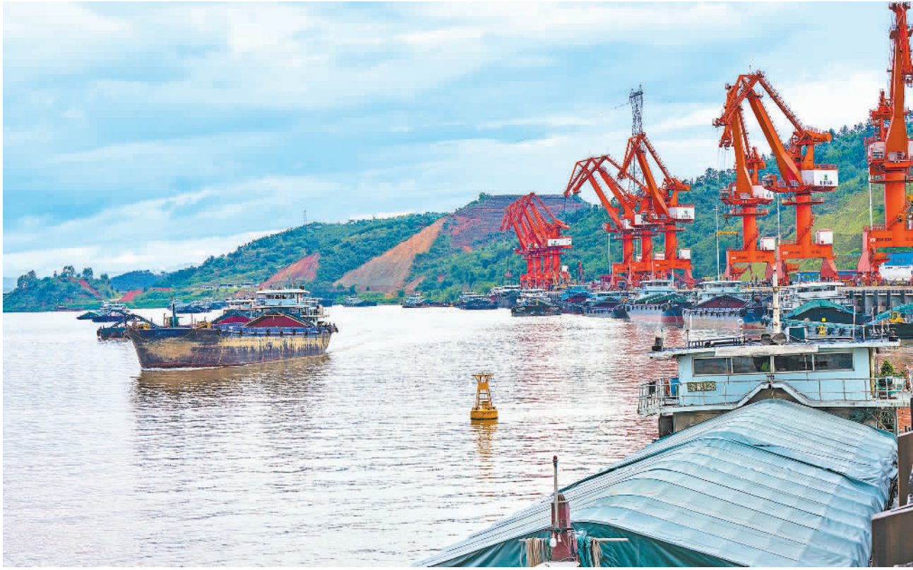
5月21日，广西梧州藤县港区赤水圩作业区码头，船舶正在进行装卸作业。该码头是西江流域上唯一集铁、公、水、空港于一体的大型内河综合性码头，为流域内企业提供了低成本、方便快捷的物流中转通道。