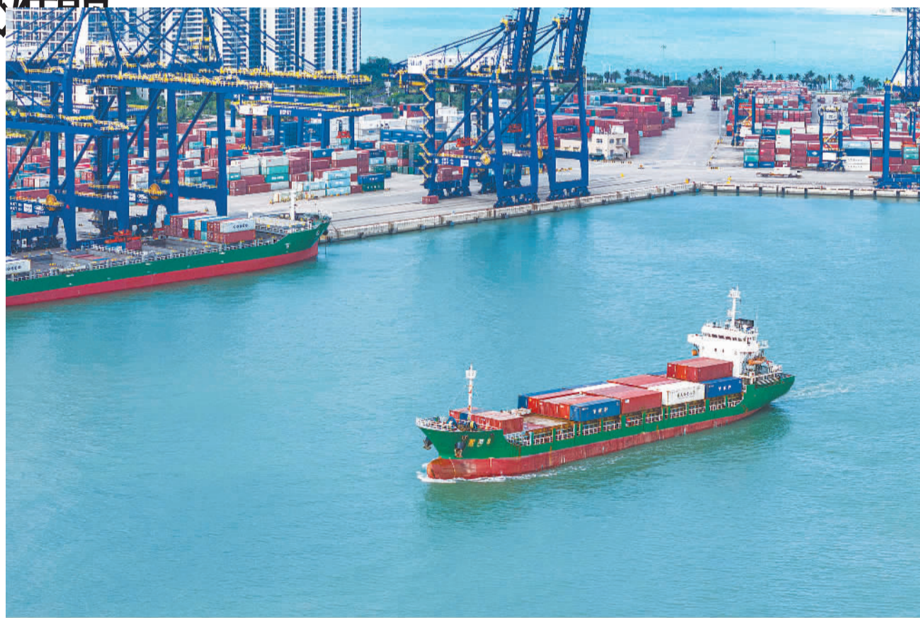
日前,在海口秀英港集装箱码头,满载集装箱的货轮有序离港。今年前4个月,海口市货物贸易进出口总值为262.8亿元,占同期海南外贸进出口总值的29.9%。

近年来,湖北充分发挥科教和产业基础优势,将生命健康产业作为重点打造的万亿元级支柱产业之一,去年产业规模达到8810亿元,今年有望突破万亿元。武汉国家生物产业基地竞争力居全国生物医药产业园区第四位、中部第一位,已逐步形成以生物产业基地为龙头,宜昌、荆门、十堰、天门、黄石、仙桃、黄冈、鄂州、恩施9个区域性生物产业园为支撑的“1+9”联动发展格局。