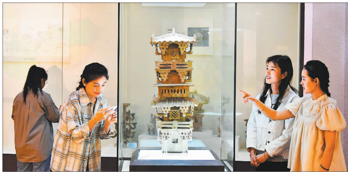
▲5月16日，观众在河北省迁安市博物馆观赏汉墓出土的陶楼。为迎接5月18日国际博物馆日，人们纷纷走进博物馆，感受中华传统文化的魅力。