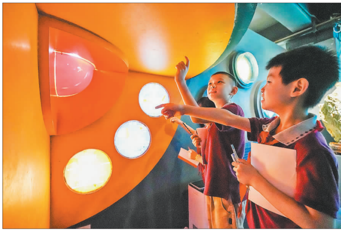
▼5月11日，福建省煤田地质勘查院地质博物馆，小学生在观看地球内部结构模型。