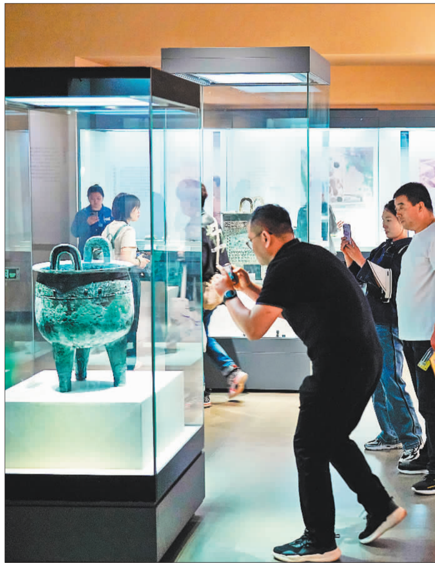
▼5月3日，游客在江苏南京城墙博物馆参观。该馆创新融合了文物实物、场景复原、数字沙盘、多媒体展示以及观众互动等多种形式，全面展现南京城墙的历史文化和遗产价值。