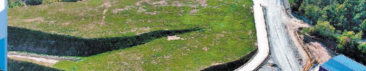
图为塞尔维亚博尔铜矿。