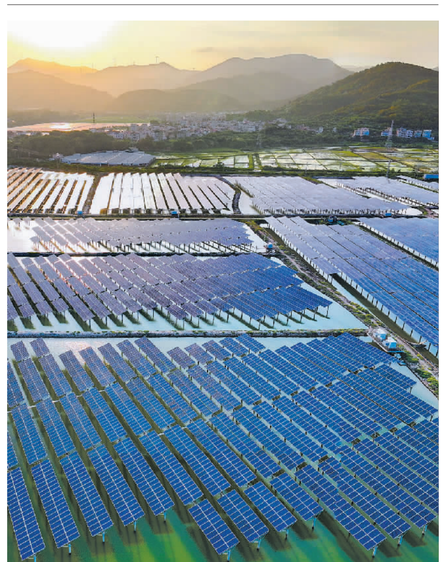
5月10日，福建省福清市一处螃蟹养殖池塘，光伏发电板在阳光下熠熠生辉。近年来，当地充分运用沿海滩涂、沼泽发展光伏发电产业，推进绿色低碳能源建设体系。

中之重是确保人道主义救援，根本出路是落实“两国方案”。中方支持尽快召开更大规模、更具权威、更有实效的国际和会会议，推动巴勒斯坦问题早日得到全面、公正、持久解决。