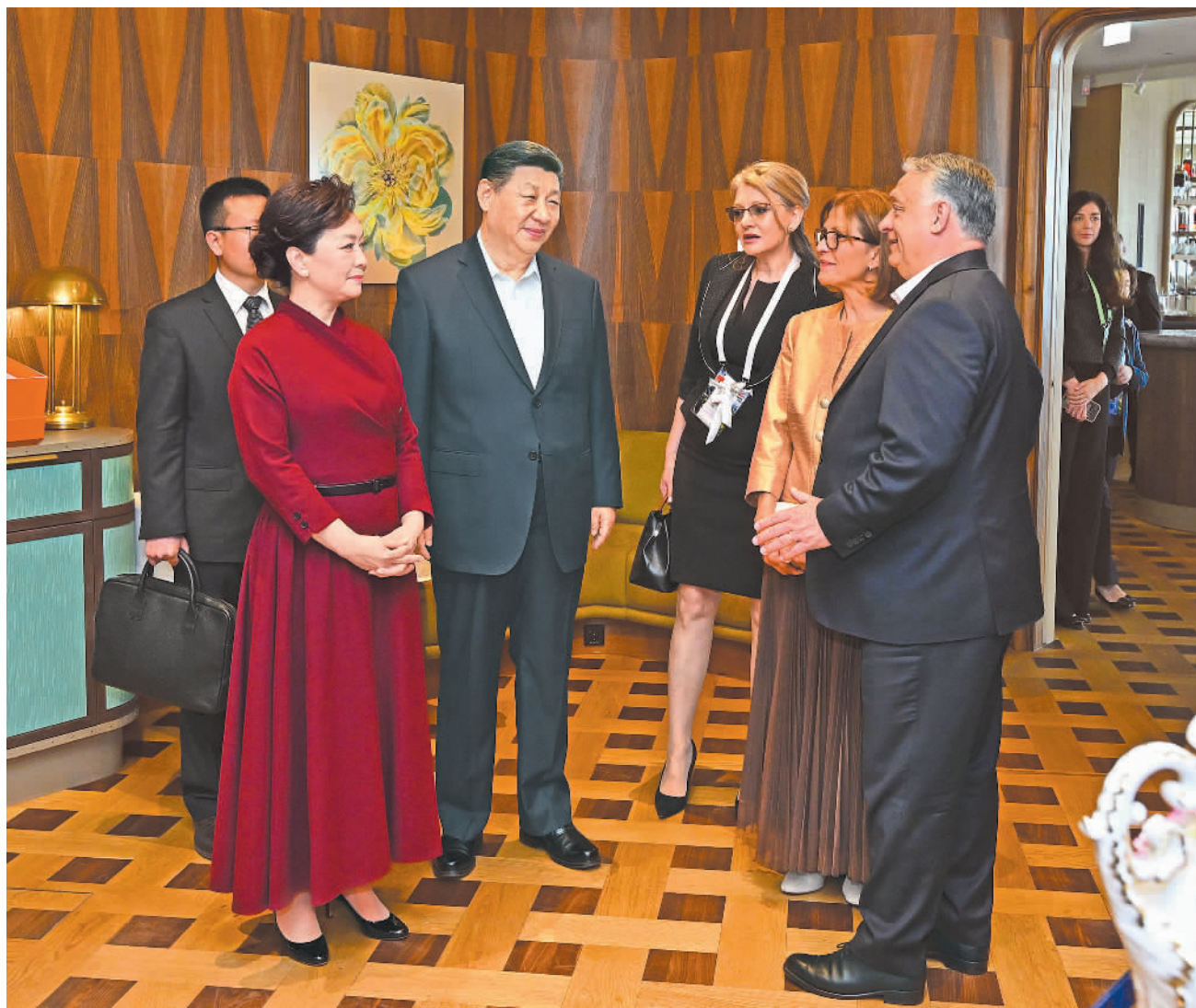
当地时间5月10日中午,国家主席习近平和夫人彭丽媛在布达佩斯应邀出席匈牙利总理欧尔班和夫人举行的饯行活动。

本报布达佩斯5月10日讯(记者翟朝辉 陈希蒙)当地时间5月10日中午,国家主席习近平和夫人彭丽媛在布达佩斯应邀出席匈牙利总理欧尔班和夫人举行的饯行活动。