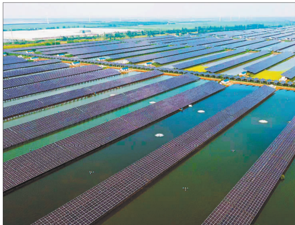
►4月12日,俯瞰崇明区陈家镇110兆瓦渔光互补光伏发电项目。项目将“绿色能源+水产养殖”有机融合,推动绿色低碳高质量发展。