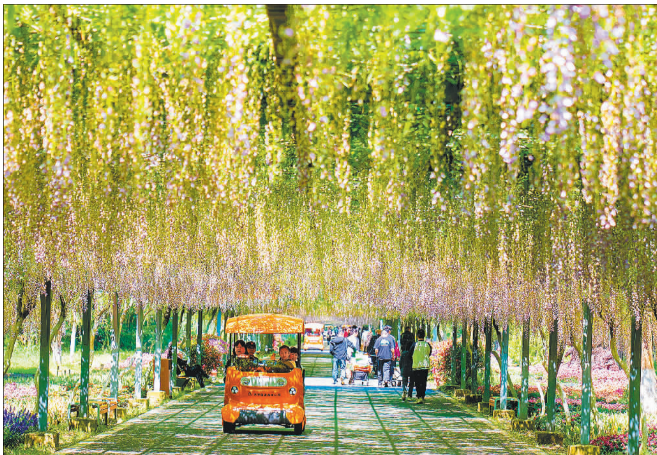
▲5月1日,崇明区东平国家森林公园内600余种、300万株花卉相继吐蕊,吸引众多游客前来打卡。

践行“两山”理论,上下同题共做。如今,崇明正全力打造人与自然和谐共生的生态标杆。这里也是一片富有活力、充满魅力的宜居地。