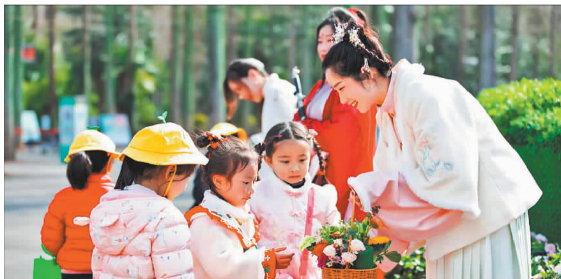
▲3月21日,崇明区东平国家森林公园,游客参加“2024崇明花朝节”活动。崇明区以花为媒,促进产业兴旺,推动乡村振兴。