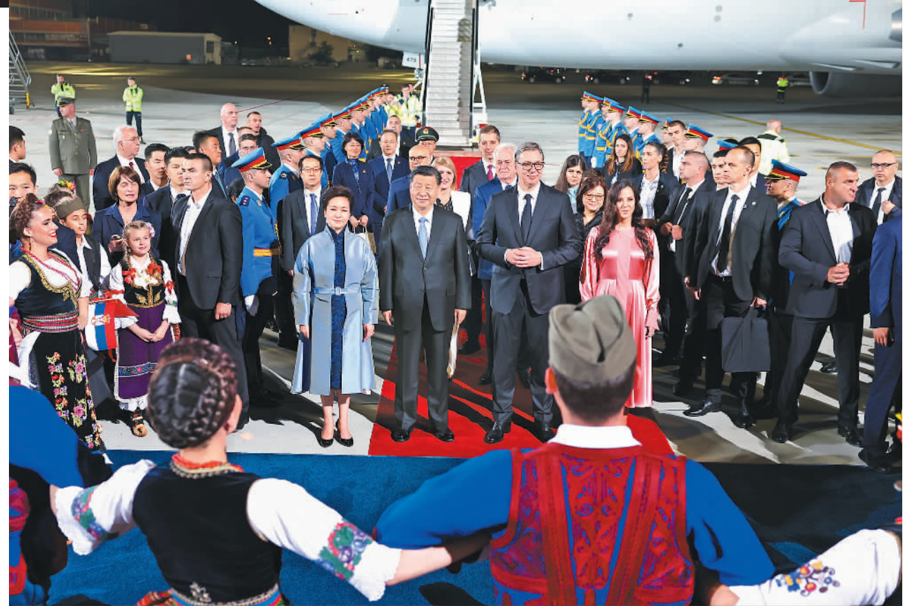
当地时间5月7日晚,国家主席习近平乘专机抵达贝尔格莱德,应塞尔维亚总统武契奇邀请,对塞尔维亚进行国事访问。习近平乘坐专机抵达贝尔格莱德尼古拉·特斯拉国际机场时,塞尔维亚总统武契奇夫妇,对华合作国家委员会主席、前总统尼科利奇夫妇,议长布尔纳比奇,总理武切维奇和外交部长久里奇等热情迎接。