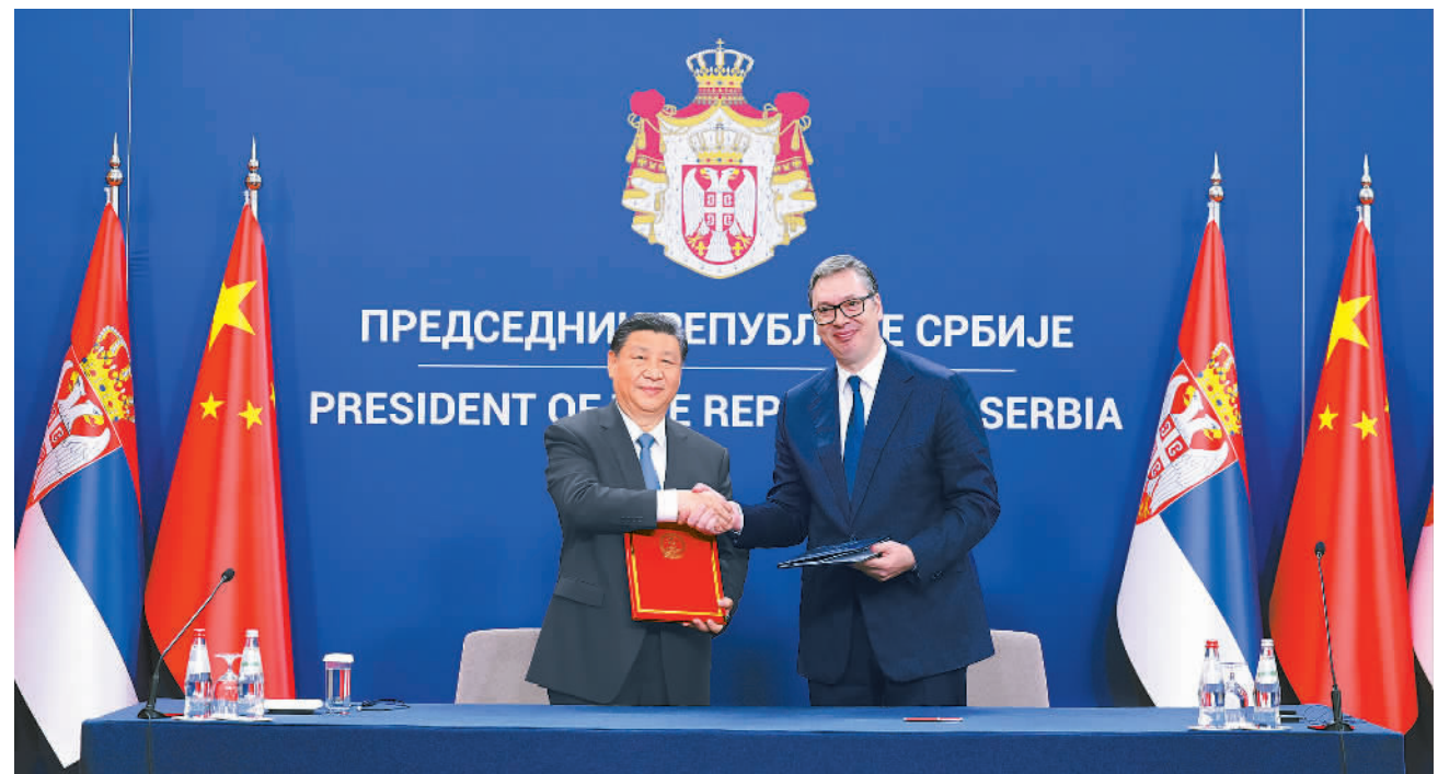
当地时间5月8日上午,国家主席习近平在贝尔格莱德塞尔维亚大厦同塞尔维亚总统武契奇举行会谈。会谈后,两国元首共同签署《关于深化和提升中塞全面战略伙伴关系、构建新时代中塞命运共同体联合声明》。