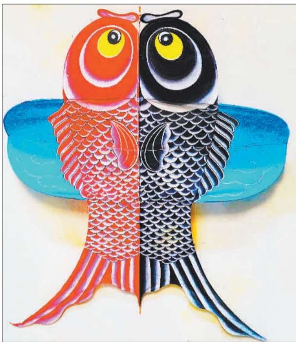
双鱼呈祥(摄于4月24日)。