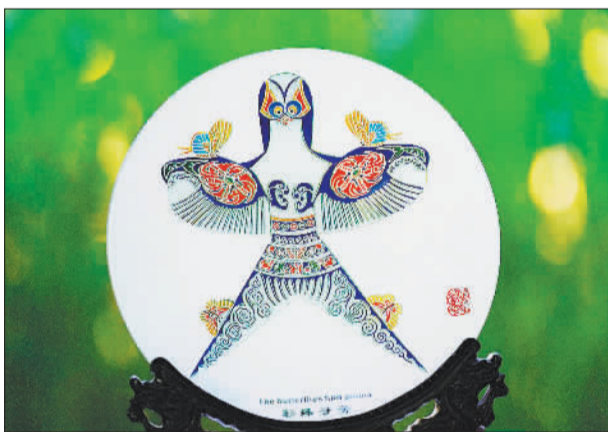
彩蝶寻芳(摄于4月23日)。