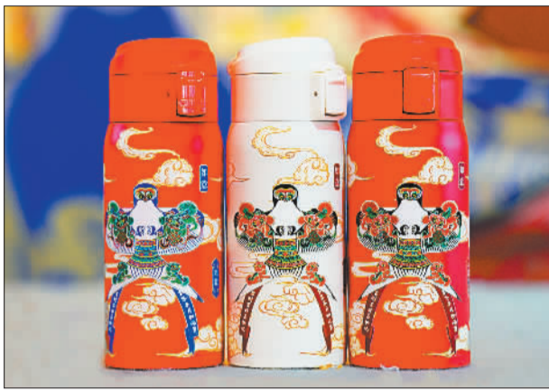
四世同堂(摄于4月23日)。