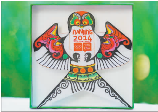
福寿双全(摄于4月23日)。