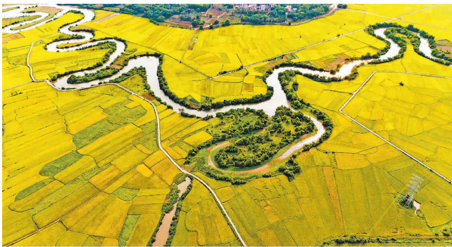
4月28日,位于海南省海口市琼山区云龙镇三十六曲溪湿地旁的水稻陆续迎来收割。目前,当地水稻进入成熟期,农户们正加快抢收,确保颗粒入仓。

当前,国际环境复杂严峻,需求不足制约犹存,经济持续回升向好的基础仍需加固巩固。周毅仁表示,要按照党中央决策部署,强化精准施策,进一步发挥各地比较优势,深入实施区域重大战略和区域协调发展战略,支持各地区走合理分工、优化发展的路子,因地制宜加快培育新质生产力,有效提振国内需求,切实稳定外贸基本盘,推动区域经济持续向好。