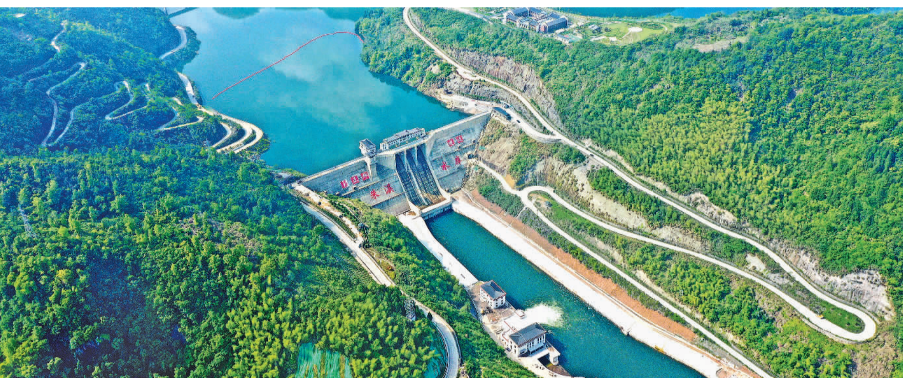
4月27日，浙江省台州市仙居县朱溪水库在青山绿水环抱下，宛如一幅美丽的生态画卷。近年来，当地建成朱溪水库、孟溪水库、方溪水库及台州市引水、南部湾区引水工程等一批水利工程，水安全保障能力不断提升。

来自日本、美国、韩国、加拿大、马来西亚、泰国、英国、澳大利亚、俄罗斯、法国等。境外游客喜欢的国内目的地包括上海、北京、广州、成都、青岛、杭州、重庆、深圳、西安、昆明等。