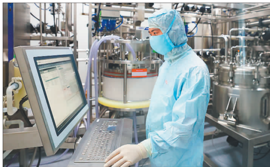
▼4月16日，山西锦波生物医药股份有限公司生产车间。作为国家级专精特新“小巨人”，锦波生物生产的重组III型人源化胶原蛋白系列产品填补了该领域的相关技术空白。