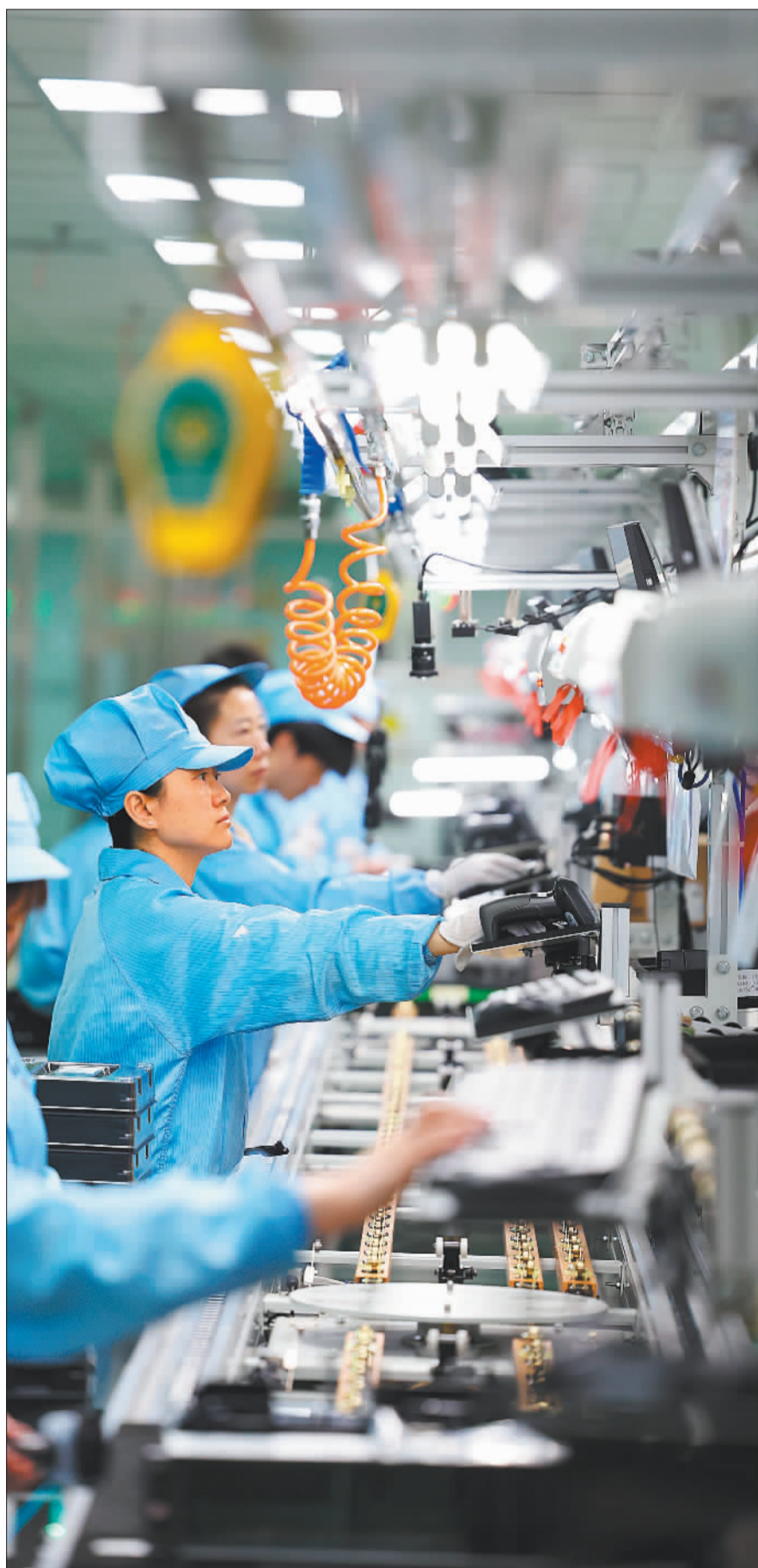
▲4月17日，晶科能源股份有限公司，员工在生产线上巡检。晶科能源规划的年产56GW垂直一体化大基地项目，将是全球首个包含硅片、电池、组件的“超级一体化”太阳能工厂。