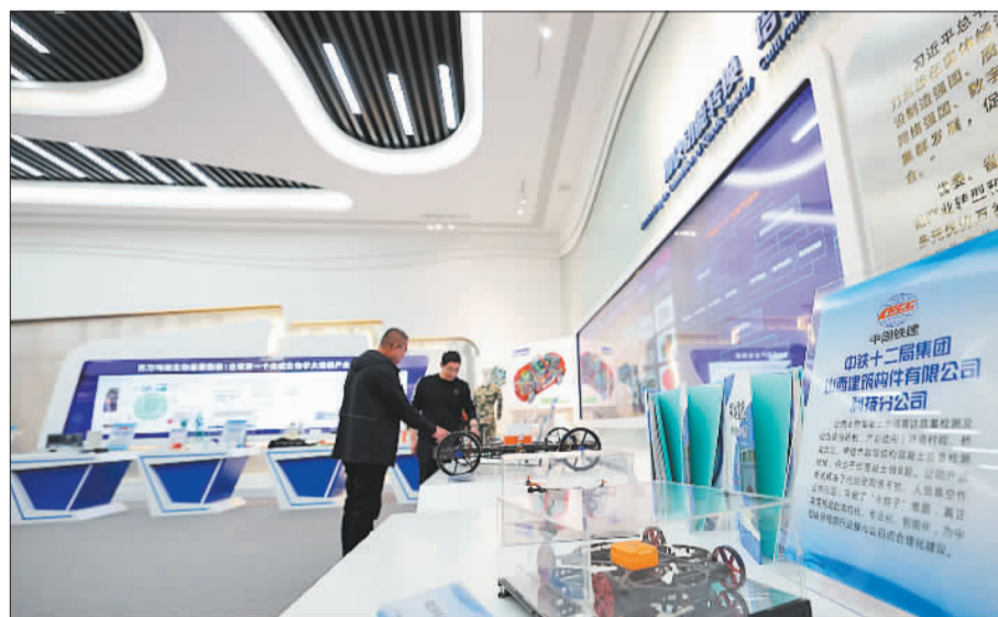
▲4月16日，观众在山西转型综合改革示范区政务服务中心改革创新展厅参观。一项项“硬核”科技成果，直观展示了山西转型综合改革示范区培育新兴产业集群取得的新进展。